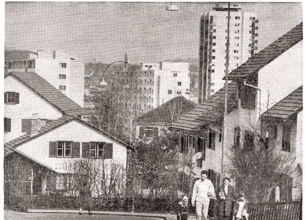
Im Vordergrund: Die Siedlung Mattenhof. Hinten: das Punkthaus Schwamendingen.