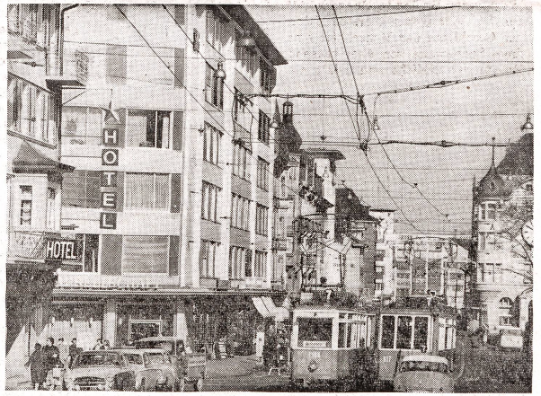
Lebhafter Verkehrsknotenpunkt: Beim Hotel «Sternen» in Oerlikon.