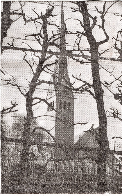
Die schöne reformierte Kirche Oerlikon durch das Spalier gesehen.