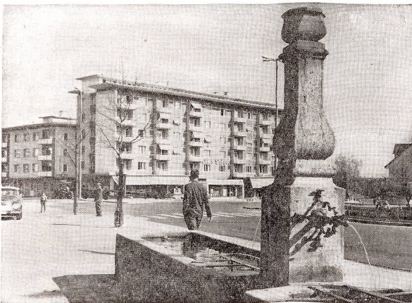
Links: Alt und neu am «Hauptplatz» in Schwamendingen.