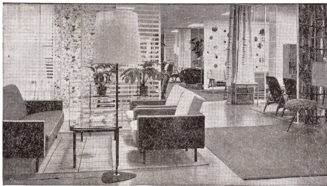
Blick in unsere neue Ausstattung- und Möbel-Abteilung