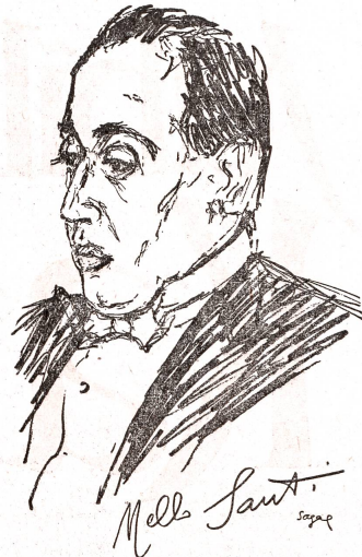
Nello Santi, der die römische Kapellmeisterschule höchst erfolgreich absolviert, wirkte seit kurzer Zeit als Operndirigent am Stadttheater Zürich. Dieser Beselle ist nach allgemeinem Urteil für Musiker und Sänger ein unbezahlbarer Musikpädagoge. Das Musiktheater hat in diesem tiefempfindenden, technisch großartigen Maestro tatsächlich einen Schaffer ersten Ranges. Unter Santis herrlich ausdeutender Dirigentenhand werden gegenwärtig im Stadttheater Zürich die Aufführungen von «Butterfly», «Macht des Schicksals», «La Bohème» und «Lucia von Lammermoor» zum tiefen Opernerlebnis. Jede «Lucia»-Aufführung wird durch Santi zu einem Fest.

von Not und Trauer erklangen schnell wieder die Melodien Mozarts und Verdis, Bizets und Smetanas. Auch heute noch opfern die Völker, die die allerschwersten Kriegswunden zu heilen hatten, Summen für die musikalische Kultur, welche weit über das hinausgehen, was die Schweizer Städte, die reichen, nie