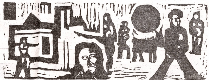
Pieter Ott: «Komposition», 1957. Das Schwarz-weiß-Blatt bringt in kraftvoller und scharf abgegrenzter Kontur das Nebeneinander des Geschehens im täglichen Leben, gewissermaßen als Spiegelbild, eindringlich und nachhaltig zum Ausdruck.

Gebäudeversicherung: Von 3389 (3572) Gebäudeschätzungen entfielen 2017 (2186) auf Schätzungen im Revisionsverfahren und 1372 (1386) auf Einzelschätzungen, wovon 436 (645) durch Neubauten bedingt. 249 (263) Gebäude wurden infolge Abtragung abgeschrieben. Der Prämienbetrag betrug unverändert 55 Rappen vom Tausend der Versiche-