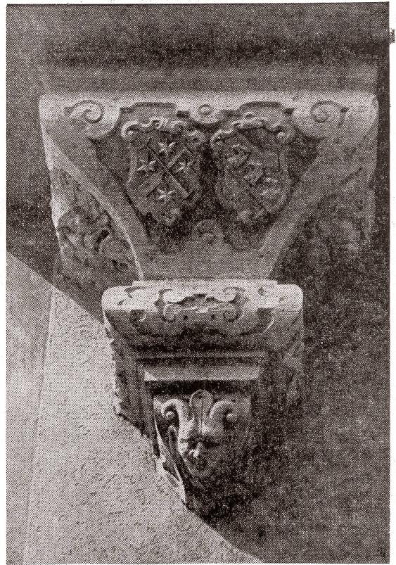
Erkerfuß am Haus «zum großen Erker», mit Wappen Waser und Haab, um 1630, Schipfe 49, Zürich

An den Hochschiffwänden, den Chormauern und Emporen, den Ge- wölben und am Karlsturm unseres Großmünsters, am Rippengewölbe der Wasserkirche, ja an den Werk- stücken einer großen Zahl Wohn- häuser der Zürcher Altstadt finden sich unzählige dieser Steinmetz- zeichen eingehauen, oft schlicht, aber auch zu wahren kleinen Meisterwer- ken geformt. Die sandsteinerne Wange der Wendeltreppe im Haus «zur Kerze» am Rüdtenplatz weist von unten bis oben solche Ehren- zeichen auf.