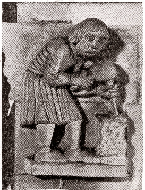
«Der Bildhauer» über dem Durchgang in den Kreuzganghof im Großmün- ster Zürich