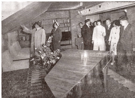
In dem von der Lignum gezeigten Musterhaus stehen wir hier im Dachgeschoss, wo sich das Musikzimmer (mit eichenfurnierten Ecoform-Fasriemen, Möbel aus Palisanderholz und einer Bücherwand aus Tanne und Magahoni) befindet.