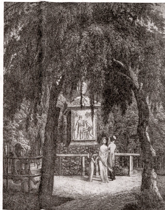
Das Salomon-Gebner-Denkmal im Platzspitz, nach einer Radierung von F. Senn.