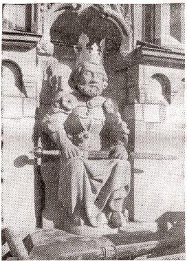
Plastik Kaiser Karl des Großen am Karlsturm des Großmünsters, Kopie von 1931/37, nach dem Sandsteinoriginal des 15. Jahrhunderts.

Die Griechen schufen ihren Göttern, Dichtern und Kriegshelden herrliche Skulpturen und Reliefs; sie ließen sie für ihre Nachwelt nochmals aufstehen, damit sie erzählen mögen von unsterblichen Dichtungen, ruhmreichen Taten, einer hohen Blütezeit im Altertum. Unsere südlichen, westlichen und nördlichen Nachbarn wiederum liebten es, ihre Heerführer und großen Staatsmänner auf ehernen Rosse zu setzen, damit sie von den hohen Sockeln hinausschauen in das Land, dem sie einst Schutz boten, das sie magisterial regierten, um das Volk aus der Unterdrückung der Freiheit entgegenzuführen und Werke der Humanität zu erfüllen.