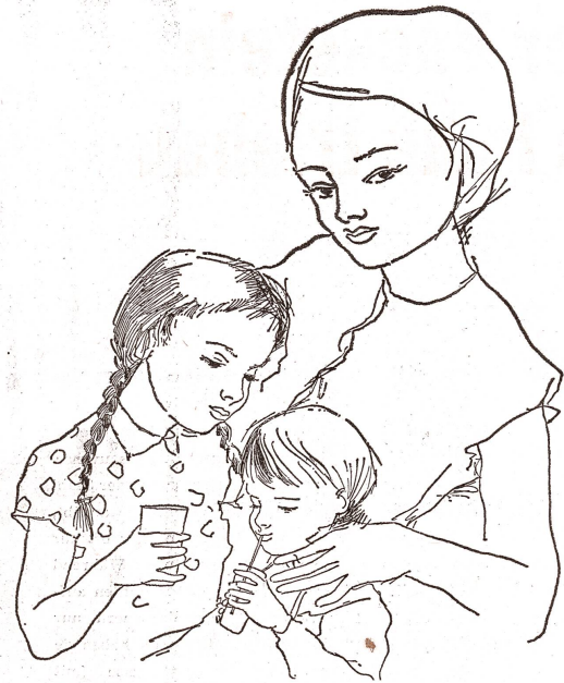
Weniger Kohlensäure in den Kronkorkflaschen — Große Flaschen mit JUWO-Punkten.