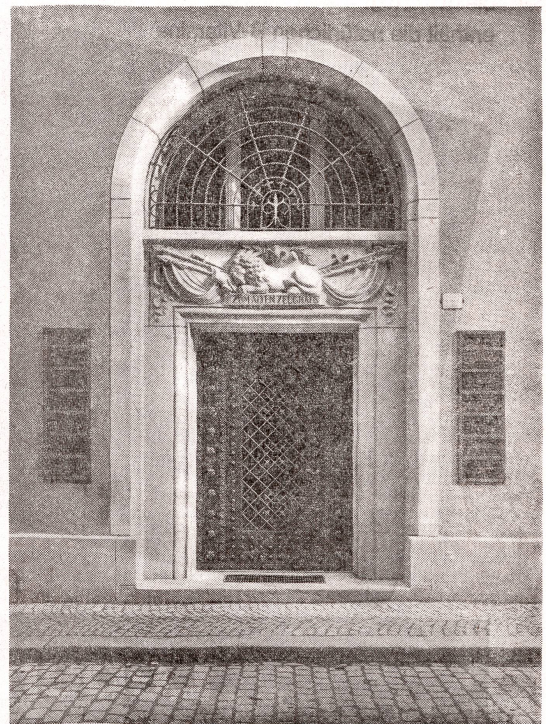
Die schöngestaltete Eingangstüre am Haus «Zum alten Zeughaus»