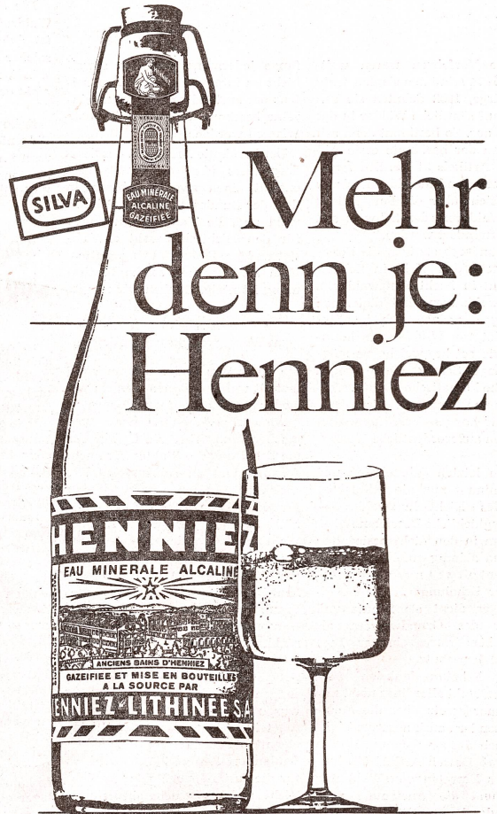
Henneiz-Lithinée S.A. sources minérales naturelles