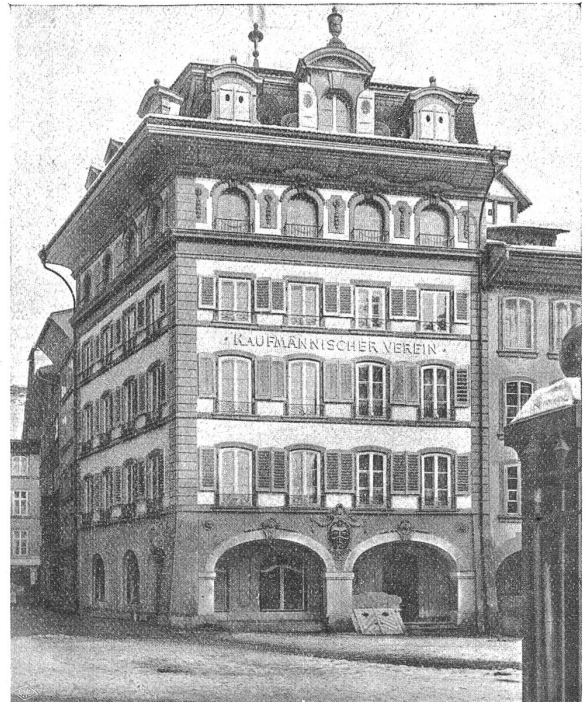
Das Vereinshaus des Kaufmännischen Vereins Bern an der Herrengasse.

Im Jahre 1869 betrug die Auflage des Stundenplanes 150; heute 1500. Bereits 1869 wurde die Subventionierung der Kurse durch die Stadt angeregt, aber die Petition blieb ohne Erfolg. Erst im Jahre 1890 wurde dem Vereine eine solche von Fr. 200 bewilligt, während ihm schon 1886 eine indirekte Bundessubvention zugesprochen wurde. Die letztere erreichte dann 1895 die Höhe von Fr. 3100; 1905/06 Fr. 10,007 und 1910/11 Fr. 18,625. Aber im Jahre 1897/98 betrug die von der Stadt an den Verein ausgerichtete Subvention Fr. 1500; 1907/08 Fr. 8000 und 1910/11 Fr. 10,000 während der Kanton 1897/98 bereits Fr. 1300 1907/08 Fr. 18,000 und 1910/11 Fr. 21,000 an den Verein ausbezahlt. Diese Zahlen sprechen besser als alle Worte von der Entwicklung, die die wesentlichste Institution des Kaufmännischen Vereins im Laufe der Jahre genommen hat. Hier ein weiteres Beispiel: 1888/89 war die höchst erreichte Schülerzahl pro Semester 69, 1898/99 254, 1908/09 717 und 1910 845. Die Auslagen hielten Schritt damit. 1888/89 überschritten die Lehrerhonorare allein den Betrag von Fr. 2000 und stiegen von da an sehr schnell. 1898/99 betrugen sie Fr. 10,420, 1908/09 Fr. 38,065, 1910/11 aber Fr. 45,876. Das ist nur ein flüchtiges Bild von der Ausdehnung des