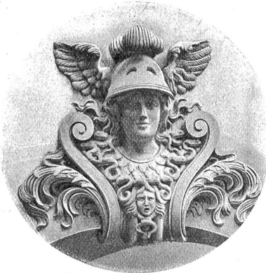
„Pallas Athene“ über dem Eingang des Kaufmännischen Vereinshauses.

Wenn ein Verein auf eine 50 jährige Dauer seines Bestehens zurückblicken kann, hat er naturgemäß auch seine Geschichte. Diese ist um so interessanter, je vielseitiger die gestellten Aufgaben und je mannigfaltiger die Bestrebungen sind, die im Laufe eines halben Jahrhunderts angefangen und verwirklicht worden sind. Der Kaufmännische Verein Bern hat auf den Anlaß seines Fünfzigjahr-Jubiläums eine Denkschrift herausgegeben, aus der wir einiges unsern Lesern mitteilen wollen. Die Schrift kann zum Preise von 50 Cts. beim Schulsekretariat bezogen werden.