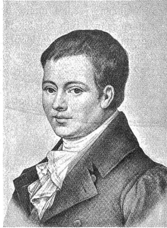
Heinrich von Kleist. (Jugendbildnis.)

war hier in der Schweiz abgeschlossen worden, die Unreise desselben fühlte aber Kleist so stark, daß er sofort von einer „elenden Scharsteke“ sprach, und doch genießen wir noch heute