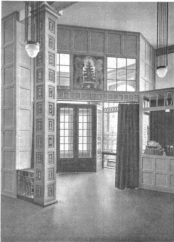
Buchhandlung A. Francke: Vestibül, Windfang und Kasse.

lichen. Diese Aufgabe hat der Architekt in einer glücklichen Weise in zwei einladenden Sophaecken, in einzelnen Tischchen, mit praktisch gebauten Sesseln umgeben, gelöst. Die nämliche