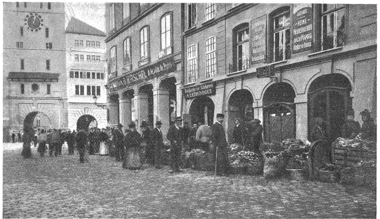
Der „Ziebelemerit“ in Bern.