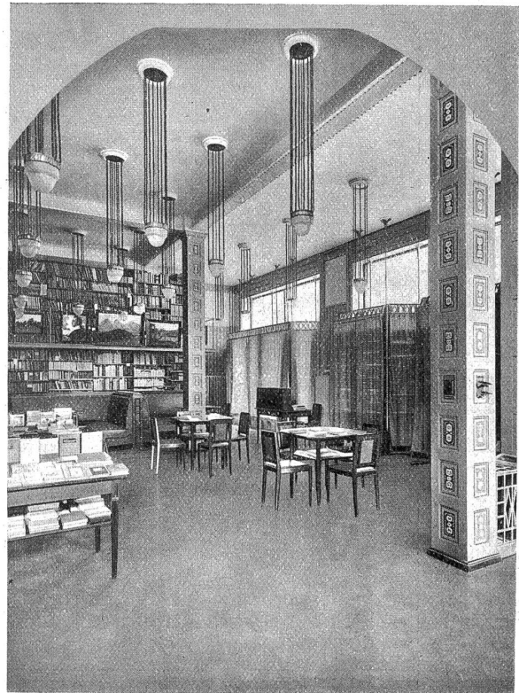
Buchhandlung A. Francke: Ladeninneres.

wegs mit viel Sorgfalt bedacht werden (Schaufenster-Wettbewerb), einen bedeutenden Erziehungsfaktor im öffentlichen Leben. Von der Innenausstattung geben die eingestreuten Bilder einige Eindrücke wieder.