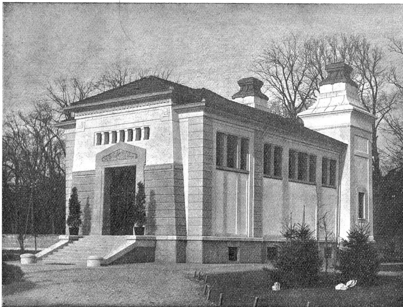
Das Krematorium in Bern.

wir versuchen, in Kürze den Hergang einer solchen im Ofenraume zu beschreiben.