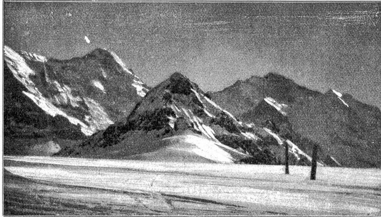
Auf der Kleinen Scheidegg.

surr, leicht bergab. Wie schwillt die Brust vor verhaltener Luft, wenn das Auge über die ewig wechselnde Szenerie huscht, wenn der Schnee stäubt und die kräftige Luft über die Wangen streicht! In wenigen Minuten erreichen wir die Wengernalp und tauchen bald darauf in den Bergwald. Bei einer Biegung der Bahn sehen wir zu unsern Füßen das Dorf Wengen im Nachmittagssonnenschein, und tief draußen im Talaustrang wird die auf dem Aaretal lagernde Nebelschlange sichtbar.