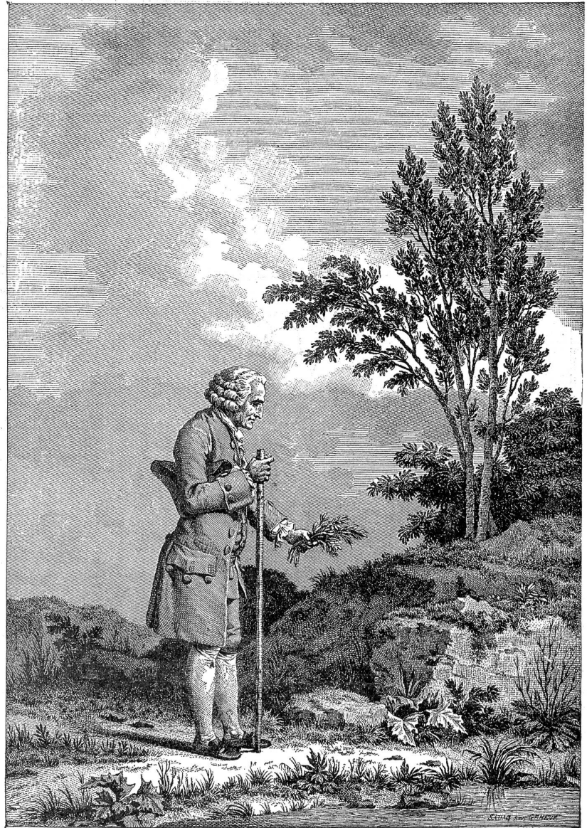
Rousseau auf dem Felde.

Während der drei Jahre, da Rousseau in der Verborgenheit des Traverstales weilte, fing er an, mit Leidenschaft Botanik zu studieren. Er ließ sich von seinen Buchhändlern den Linné und andere botanische Werke zusenden. Auf der Jagd nach Blumen durchstreifte er den Neuenburger Jura weithin nach allen Richtungen, und in den kurzen glückseligen Wochen auf der Petersinsel im Bielersee hielt er sich außer den botanischen alle Bücher vom Leib. Er wußte gar wohl, daß er in der Pflanzenkunde ewig ein Dilettant bleiben werde, solches hinderte ihn nicht, sich ihr bis in die letzten Altertage zu widmen. Die Botanik war ihm ja doch nur Vorwand seines unerfättlichen Wandertriebs, und mit C. F. Meyer hätte er von seinen Wanderfüßen sagen können: