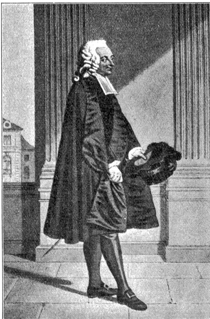
Der Ratsherr. Nach Freudenberger.

Vor allem war also dem alten Berner die Osterzeit eine Zeit schwerer Sorge, Tage, da sozujagen sein poli-