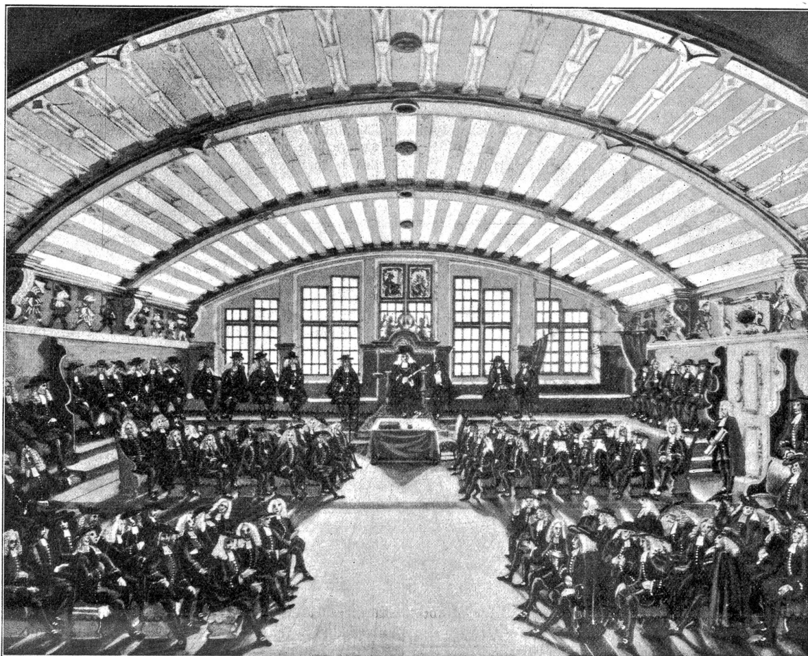
Sitzung des Grossen Rats im Jahr 1735.

tisches Schicksal sich entschied. Doch vergaß man auch hier der Feste nicht, die nun einmal im Mittelalter zu einer Haupt- und Staatsaktion unabänderlich gehören. Auch der oben beschriebene Umzug ist dahin zu nehmen. Vor der folgenschweren Verlesung der Namen im Rathaus fanden sich nämlich die Bürger auf ihren Zunftstuben zusammen und verzehrten den Krautfuchen, nachher zogen sie beglückt oder erboßt wiederum auf ihre „Stube“ und setzten sich zum großen Ostermahl nieder, an dem ein jeder Stubengesell bei Buße teilzunehmen hatte. Wie diese Wähler gefeiert zu werden pflegten, beweisen einmal die verzehrten Mengen: 6–9 Liter Wein und 4–6 Pfund Fleisch auf den Kopf ist nichts seltenes; dann aber auch die Speisefarte: vor allem der rinderne Schlauchbraten, dann allerhand Geflügel vom Huhn bis hinunter zu den Reckholdervögeln d. h. wie Wildpret zubereiteten kleineren Vögeln, Spangfinkel, Pasteten, Fisch, Wildpret; endlich die eigentlichen Leckerbissen: Pomeranzen (1576), Spargeln (1602), Kastanien (1605), Artischocken und Kartoffeln (1609). Als Nachtmahl trug man Reisbrey oder eingemachte Früchte auf. Vor mir liegt ein Kochbuch der Apollonie Archerin von 1692; darin zählt diese z. B. eingemachte Rosen und Weilschen als süße Speise auf und erlehrt wie man Spargeln einmacht — gewiß Dinge, die auch unserer fortgeschrittenen Zeit ziemlich raffiniert vorkommen dürften.