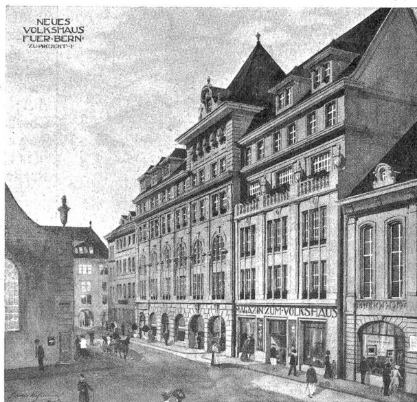
Das neue Volkshaus.

Auf Samstag den 29. April ist das letzte populäre Sym-