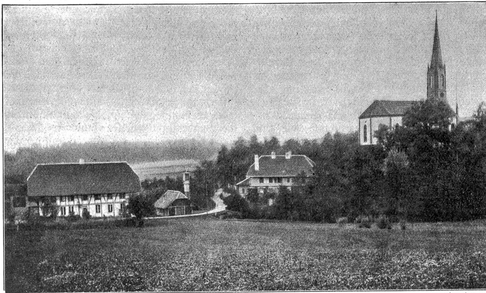
Kirche und Schulhaus in Rapperswil.