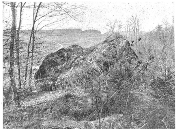
Fig. 2. Erratischer Block oberhalb Grasswil.