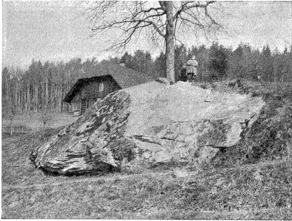
Fig. 1. Unterster Block von Obergaden.

Die im Vorlande der Berner Alpen zerstreuten erratischen Blöcke sind schon im Jahre 1825 von Bernhard Studer beschrieben worden und zwar in seinem ausgezeichneten Buche