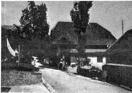
Lebender Brunnen in Gunten.

Von den Kurstätten, die im Laufe der Zeit an den Ufern des Thunersees entstanden sind, zeigen wir unsern Lesern heute einige Bildchen aus Gunten. Es liegt 565 m über Meer und ist die zweite Dampfschiffstation von Thun aus. Die außerordentliche Milde des Klimas dieser von Nordwinden geschützten Gegend des rechten Seeufers hat ihm den ehrenvollen Beinamen „die schweizerische Riviera“ eingetragen und die Zahl derer, die als Erholungsbedürftige und Ruhesuchende alljährlich nach Gunten kommen, ist nicht gering. Zahlreiche lauschige und bequeme Pfade führen zu den ausichtsreichen Höhen und durch interessante Schluchten.