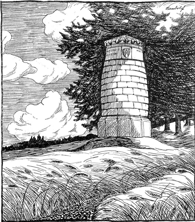
Das Denkmal auf dem Bramberg.

der Angaben und der Anschaulichkeit weit übertrifft. Aus ihm haben wohl fast alle übrigen Bearbeiter geschöpft.