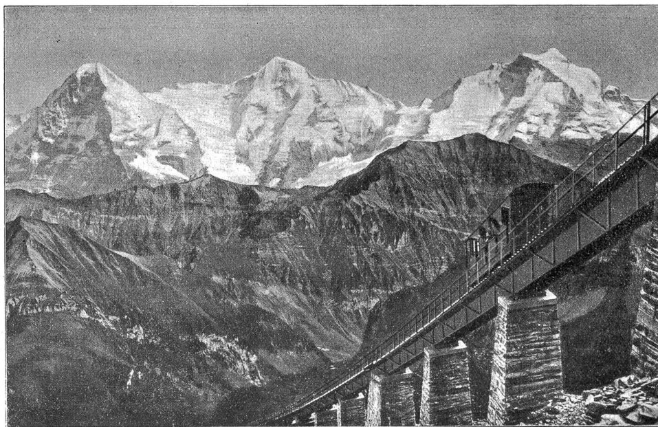
Niesen-Bahn. Hegernalp-Viadukt, 66% Steigung. — Eiger, Mönch und Jungfrau.

Die Talstation der Niesenbahn befindet sich in Mülenen an der Rander, 693 m ü. M., in unmittelbarer Nähe der Station Mülenen-Meschi des elektrisch betriebenen Teilstückes Spiez-Fru-