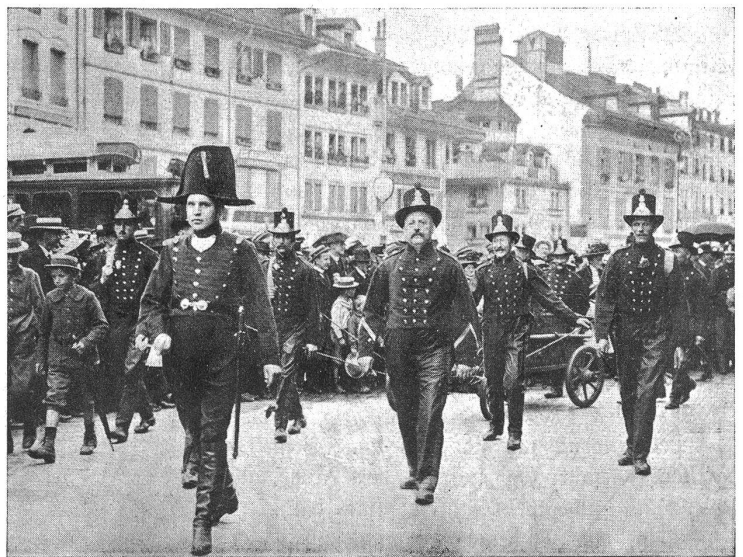
Hundertjahrfeier der Feuerwehr der Stadt Bern: Historische Gruppe.