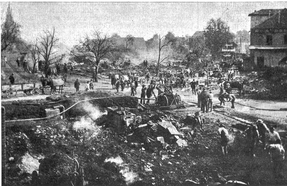
Vom Brandplatz in Hindelbank: Bei der Brennerei Witschi.