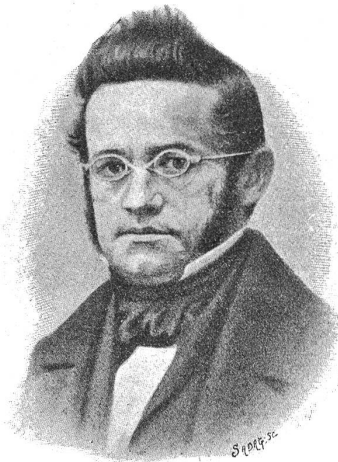
† Dr. Jonas Furrer, der erste Bundespräsident.

Jonas Furrer wurde 1805 in Winterthur geboren. Er studierte Jurisprudenz in Zürich, Heidelberg und Göttingen und wirkte von 1828 bis 1845 als Rechtsanwalt in Winterthur. 1834 wurde er in den Großen Rat berufen, 1837 zum Mitglied des Erziehungsrates und 1839 zum Präsidenten der ersteren Behörde gewählt. Dann kam der „Zürichputsch“ und legte am 5. September 1839 die Regierung weg, der es an Machtmitteln fehlte. Hierbei hüßte auch Furrer alle seine Ehrenstellen ein. An die Spitze des Landes kam eine durchaus konservative Regierung. Aber im Jahre 1845 gewann der Liberalismus wieder die Oberhand und im gleichen Jahre