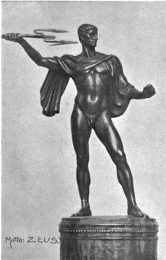
Entwurf Bildhauer Professor Hubert Netzer und Architekt Paul Pfann, München. (Vorderansicht.)

punkt des Platzes aus ein abgeschlossenes Bild, eine schöne, ruhige Silhouette vermitteln.