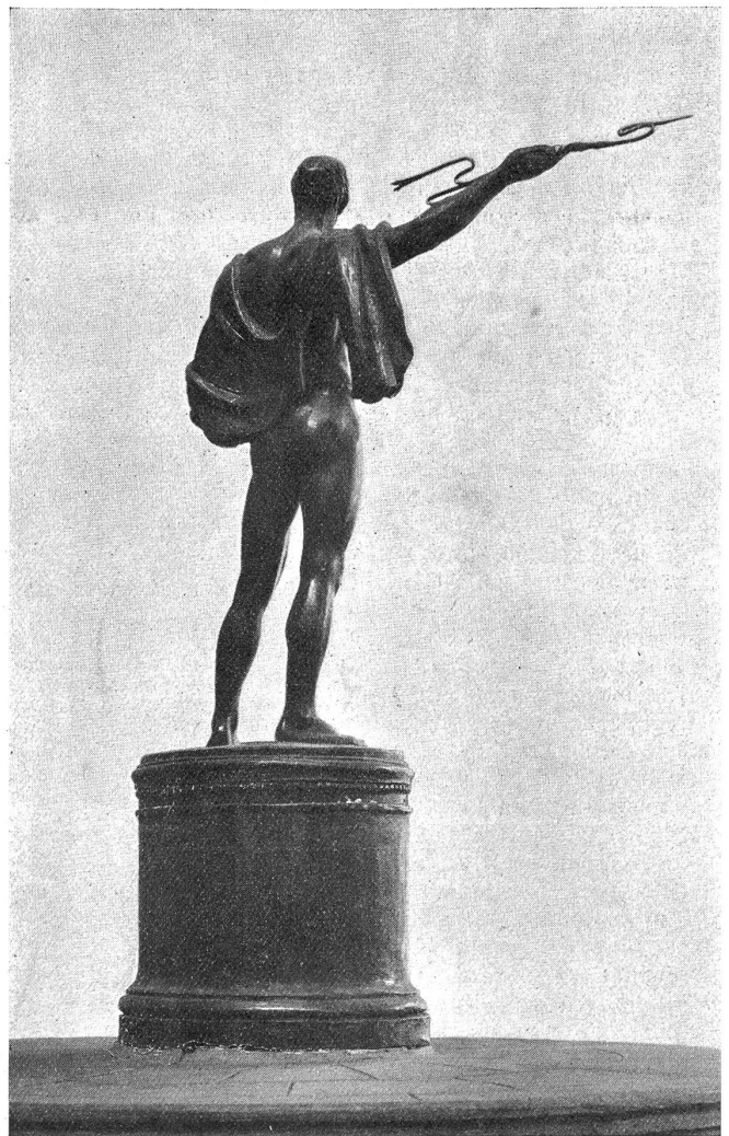
Entwurf Bildhauer Professor Hubert Netzer und Architekt Paul Pfann, München. (Rückansicht.)

Der Gesamtaufbau des vorliegenden Entwurfes ist im Sockel mit den Ausgüssen, dem breiten, flachen Becken ringsum darauf berechnet, dem Beschauer die richtige Distanz zu weisen. Die wohlabgewogenen Größenverhältnisse der einzelnen Teile, das Postament zur Gestalt zur Breite des Basins, fallen angenehm auf. Darüber hinaus bleibt uns nun noch übrig, diesen Entwurf mit den vorhin geforderten Maßen zu messen, d. h. ihn in die Mitte des Helvetiaplatzes zu stellen und uns in einem Rundgange seine Wirkung vorzustellen. Auch hier finden wir die Front gegen die Stadt, die Kirchenfeldbrücke zu betont, indem das Antlitz des Zeus dahin gerichtet ist. Die kräftig erhobene Rechte, vom linken Arm in leiser Bewegung begleitet, charakterisiert die Gestalt. Aber auch von den andern Seiten her besehen, stehen wir immer einer schön durchgebildeten Silhouette gegenüber. Mit Absicht haben wir eine Aufnahme von der Rückseite beigelegt, die ungefähr den Blick auf die Gestalt von der Thunstraße her wiedergibt. Die Lienienführung im Arm, im schönen Körper, im Stand und Spielbein vermittelt einen vornehmen Eindruck.