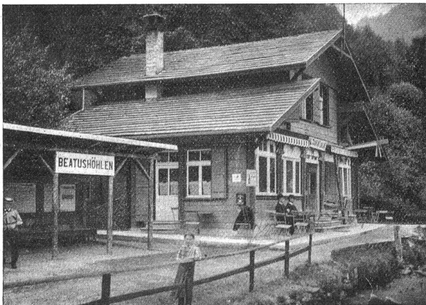
Das Restaurant „du Lac“ vor dem Felssturz.

Das Restaurant „du Lac“ bei der Schiffslände „Beatushöhlen“ am Thunersee wurde am 17. September letztthin von einem Unfall betroffen, der seinen Bewohnern leicht hätte verhängnisvoll werden können. Abends 6 Uhr löste sich hoch oben an der Fels hinter dem Gebäude ein mächtiger Stein los und fuhr in ungeheuren Sprüngen auf das Haus hinunter, das Dach und die Vorderwand des Restaurations-saales durchschlagend, und weiter dann in den See hinaus, allwo er nun seine „ewige Ruhe“ haben wird. Die drei