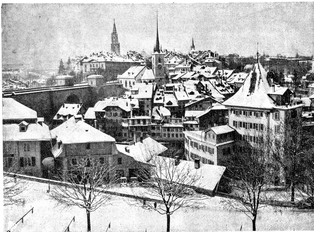
Bern im Winter.