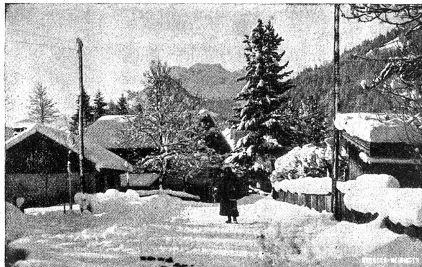
Dorfstrasse in Gstaad.

Unter den vielen Winteraufenthalt- und Wintersportplätzen, die sich in den letzten Jahren im Bernerlande aufgetan haben, gehört Gstaad sicherlich zu den meistversprochenen