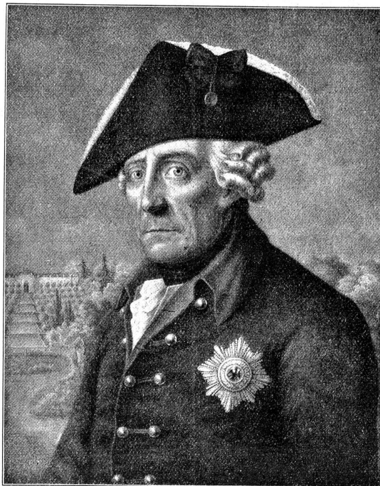
Friedrich der Große.