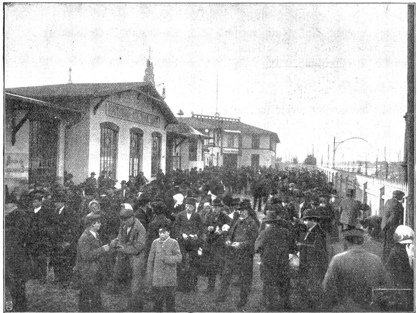
Vor der Einschiffung in Hamburg.

Die Hauptgründe, die zur Auswanderung treiben, sind jedoch ohne Zweifel wirtschaftlicher Art; und zwar haben und drüben. Das geht schon aus der Vergleichung der Einwanderungsziffern mit der Größe der Wareneinfuhr eines Landes hervor, z. B. der Union. Immer fällt eine Periode großen Warenimports mit einer solchen starker Einwanderung zusammen. Die gesteigerte Einfuhr deutet auf erhöhte Kaufkraft