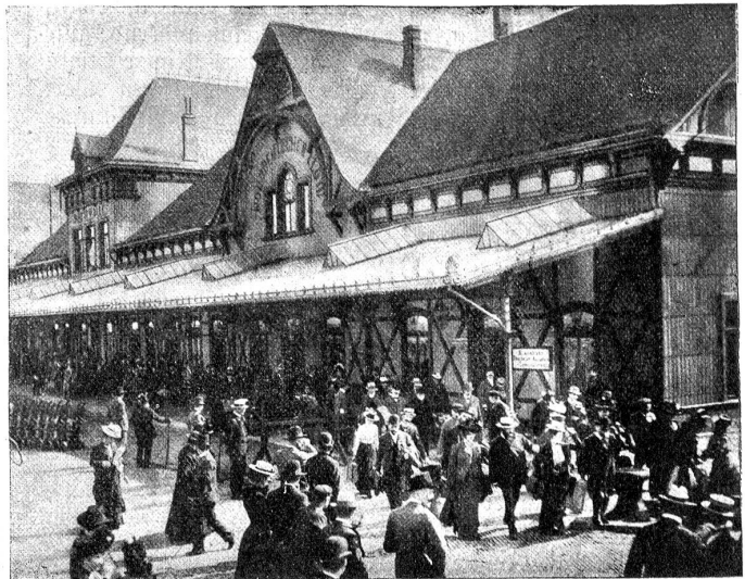
Einstieghalle des Norddeutschen Lloyd in Bremerhaven.

Es war vor hundert Jahren noch wenig verlockend, die 10 bis 20 Wochen dauernde Reise zu unternehmen. Aus einem Bericht aus dem 18. Jahrhundert vernehmen wir, daß die Reise von Bern bis Rotterdam zu Schiff auf der Aare und dem Rhein 53 Tage in Anspruch nahm und daß unterwegs sechs Personen starben. Im Jahre 1819 reiste eine Gesellschaft von 2000 Schweizern nach Rio de Janeiro; die Ueberfahrt von Rotterdam und Amsterdam aus erfolgte in zwei bis vier Monaten, während die ganze Reise vier bis sieben Monate (je nach der Gelegenheit zur Einschiffung) dauerte. 316 Personen, d. i. mehr als 15%, starben während der Ueberfahrt; auf einem Schiffe, auf dem der Typhus ausgebrochen war, sogar 109 Personen oder ein Viertel der Reisenden. Aus dem Jahre 1735 vernehmen wir, daß die Seereise 30 Kronen kostete; der Berichterstatter im „Abisblattlein“ fand diesen Betrag gering, glaubte aber, daß der Unternehmer dennoch auf seine Rechnung kommen würde, da „die meisten in der Zeit werden nach der Ewigkeit gesäglet sein.“