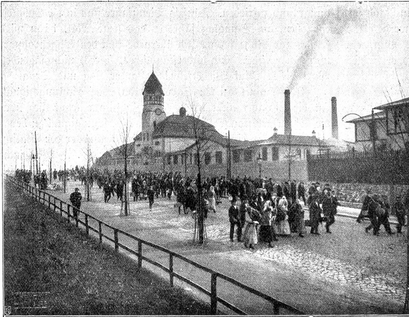
Auf dem Wege zur Einschiffung in Hamburg. Auswanderungshallen der Hamburg-Amerika-Linie.

fesseln und die wir erst recht empfinden, wenn wir uns ihrer entledigen wollen? Ist es die Unzufriedenheit mit politischen oder religiösen Verhältnissen? Das mag früher der Fall gewesen sein; solche Faktoren können auch heute noch in andern Ländern wirken. Die Emmentalerbauern, die im 17. und 18. Jahrhundert Haus und Hof verließen, um in der Fremde ein recht hartes Brot zu essen, wurden als religiöse Sonderlinge (Wiedertäufer) von ihrer Regierung bedroht und verfolgt. Aus religiösen und politischen Gründen verlassen die russischen Juden oft in Massen ihr Land. Bei uns spielen diese Ursachen gegenwärtig keine Rolle. Wohin sollten sich denn die Unzufriedenen wenden, um mehr Volksrechte oder weitherzigere Glaubensfreiheit zu finden? Nein, wenn man alle Gründe der Auswanderung aufzählen wollte, müßte man alle Motive menschlichen Handelns überhaupt nennen. Es kann Ehrgeiz oder Gewinnsucht sein; enttäuschte Hoffnungen oder der Verlust gesellschaftlicher Anerkennung, Abenteuerlust oder Wandersinn spielen mit; Tatendrang, dem die Grenzen der Heimat zu eng sind und Wißbegierde treiben manchen hinaus. Und zumal, wenn es gilt, jene neue Welt zu betreten, in der so mancher schon sein Glück gemacht hat, wo mancher sich vom Zeitungsjungen zum Millionär aufgeschwungen hat! Dieses „Freiland der unbegrenzten Möglichkeiten!“ Denn von den vielen, vielen Stillen, die kaum auf gerettetem Boot