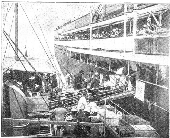
Auswanderer gehen in Bremerhaven an Bord.

Der Entschluß hiezu wird heutzutage leicht; eine Fahrt von acht bis zehn Tagen bringt den Auswanderer sicher an sein Ziel. Als noch große Schwierigkeiten und Gefahren der Reise, Unsicherheit des Verkehrs, Unwahrscheinlichkeit oder Unmöglichkeit der Rückkehr u. a. das Unternehmen der Auswanderung hemmten, brauchte es schon außerordentliche Gründe, wenigstens wenn all diese Hindernisse bekannt waren.