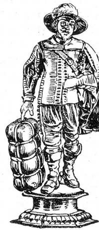
Becher der Kaufleute von 1699