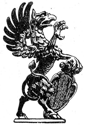
Hauszeichen der Weber

schon um 1450 zusammengetan haben. Weiter bildeten die Weber, die Schuhmacher, die Schneider, die Kaufleute, die Steinmetzen, die Zimmerleute, die Schiffsleute und die Rebleute je eine Stube. 1477 legte die Obrigkeit die beiden Schützenstuben zusammen; doch verliert sich die zunftähnliche Stellung der Schützen rasch, sodaß sie von der Reformation weg sich in nichts von einem modernen Schützenverein unterscheiden. Die Kontingente von nicht weniger als 18 städtischen Gesellschaften zogen nach Murten, ein Jahrhundert später gab es deren noch 14 und seit dem Aussterben der Rebleute Stube im Jahr 1729 noch 13. Seit 1674 billigte man den Adligen zum Narren und Distelzwang den Vortritt zu, ihnen folgen die 5 Wennergesellschaften zu den Pfistern, Schmieden, Metzger, Gerbern und zum Mittelweien, dann die drei Handwerke, welche für die leibliche Bekleidung sorgen, die Weber, die Schuhmacher und die Schneider zum Mohren, die Kaufleute, die zwei Bauhandwerke der Steinmetzen zum Affen und der Zimmerleute, und zuletzt die Schiffsleute. Allmählig bildete sich der Grundsatz heraus, daß ein Sohn in der väterlichen Gesellschaft bleiben konnte, auch wenn er ein anderes als das zünftige oder gar kein Handwerk betrieb; die strengere Zeit hatte nur das Stubenrecht von Handwerks wegen gekannt.