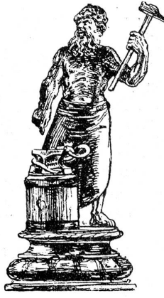
Becher der Schmiede von 1726