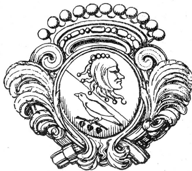
Hauswappen der Stube zum Narren und Distelzwang