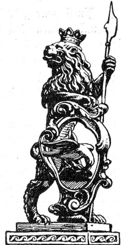
Hauszeichen der Stube zum Mittelleuen