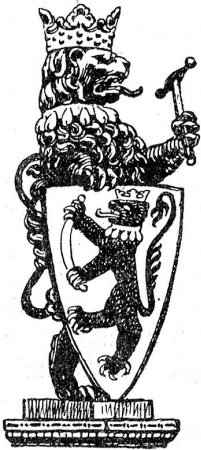
Hauszeichen der Oberberger