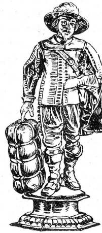
Becher der Kaufleute von 1699