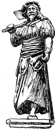
Hauszeichen der Zimmerleute