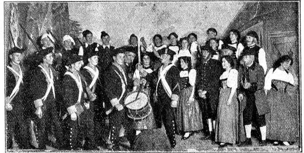
„Bärewirts Töchterli“, IV. Akt, Schlußbild.

voraus. Denn Grunder stammt aus bäuerlicher Familie; er wuchs mitten in einer Umgebung auf, in der die Kraft und Originalität des Emmenthaler Dialektes noch unverfälscht und ungechwächt fortlebt. Von seinem eigenen Vater erlauchtete er jene altertümlichen Weisen, diese stimmungsvollen Volks-