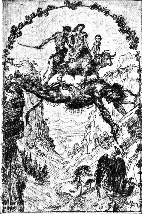
Glückwunschkarte des Künstlers für Neujahr 1902.

Morgenlicht um den Hoffenden, die Glut des leidenschaftlichen Träumers, der fahle Lampenschein des Entfagenden. Bloß ein