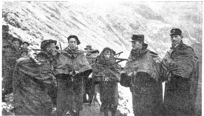
Auf dem Suften, 2. Tag. Die Zelttücher werden als Regenmäntel benutzt.

Vierter Tag: Morgens 2 Uhr werden wir von unserem kurzen, doch guten Schlafe aufgeweckt, aber keiner war unzufrieden, denn ein schöner Sternenhimmel versprach gutes Wetter. Eine Stunde später Abmarsch nach dem Rhone-gletscher. Unter kundiger Führung wurde der interessante Gletscher traversiert und nach 3 Stunden belohnte uns auf der Paßhöhe des Nägelsgrätli ein gewiß jedem unvergeßlich bleibender Blick auf Berner- und Walliser-alpen. Nur zu früh mußte wieder aufgebrochen werden, lag doch noch eine große Strecke Weges vor uns. Hinab ging's durch steile Runsen, bald über Schneefelder rutschend, bald mühsam auf steinigem Pfad der Grimsel zu. Auf der gut gebauten Grimselstraße zur Seite der jungen, schäumenden Aare am vielbesuchten Handeckfall vorbei ging es dem idyllisch gelegenen Berg-dorfe Guttannen zu, wo unsere vorausgeeilten Küchenleute Suppe und Spaß bereit hatten.