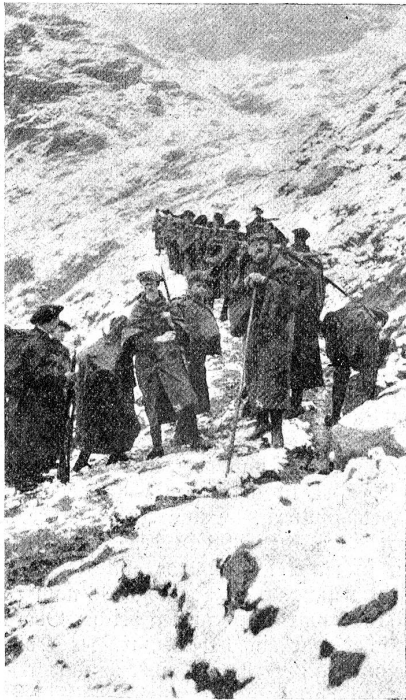
Auf dem Suften bei Schneegestöber.