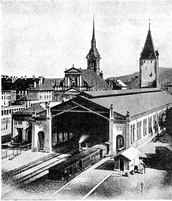
Der alte Kopfbahnhof in Bern vor dem Umbau von 1887.

Länge vom hintern Gilgut bis zum Aebigut, mit Ausnahme einer Strecke von ca. 70 m an der jetzigen höchsten Stelle der Stützmauer hinter dem Perron V, da man offenbar das Gefühl hat, daß hier das Maximum der Abgrabungsmöglichkeit bereits erreicht oder doch nahezu erreicht sei.