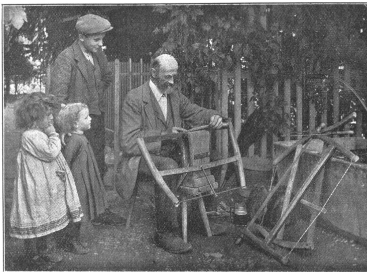
fahrendes Volk: Der Sägefeiler, der mit seinem Bock die Dörfer durchzog und von Haus zu Haus auf der „Stör“ die Sägen wieder scharf machte.

Ein andermal fragten wir zufällig: „Wo wohnt ihr dann eigentlich im Winter?“ — „Ach“ sagte die Frau und machte traurige Augen. „Da ziehen wir nach dem Elsaß, das unsere Heimat ist. Sobald sich der Wald färbt, machen wir uns auf den Weg, daß wir in den Vogesen sind, wenn der erste Schnee fällt. Dort gibt es dichtverwachsene, nachtschwarze Tannenschonungen, wo kein Schnee durchfällt und der Boden auch im Winter trocken und warm bleibt. Auch gibt es Holz genug, um das Feuer immer zu nähren. Einen Winter lang hielten wir uns auch in einer halbverfallenen Jagdhütte auf. Einen andern nisteten wir uns in der Wegelburg, einen andern im Fleckenstein ein. In den Felsenkammern und Berliessen war es warm. Im Burghof brannte dann Tag und Nacht ein Feuer. Zu essen hatten wir auf lange Zeit genug. Einen ganzen Sack getrockneter Schwämme besaßen wir und mehrere Säcke Kartoffeln, die wir unterwegs „gefunden“. Geld kam auch einiges zu uns. Vater führte diesen und jenen Jagdherrn zu der Stelle, wo der Rehbock austrat, wenn es über der Weide zu dämmern anfing. Und Vater ist selbst ein Jäger, der auf Sonntag für einen Braten zu sorgen weiß.“ Fast erschrocken und etwas verblüfft über sich selbst, schwieg jäh die Frau. — Hatte sie zu viel verraten? — Ihre milden Augen waren während der Rede lebendig geworden und blitzten. Fürchtete sie etwas von uns? Nun fiel ihre Gestalt wieder zurück. „Buben, schafft Holz herbei, marsch, fort!“ rief sie