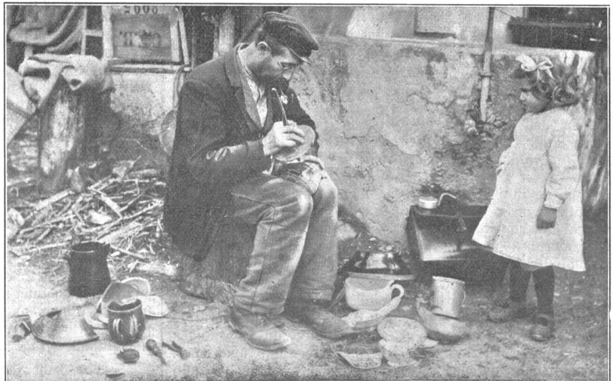
Sahrendes Volk: Der Beckihefter, der früher, als noch mehr rotes Geschirr im Gebrauch war, mit seinem wenigen Werkzeug (Bohrer, Zange, Eisendraht und Gips) von Dorf zu Dorf zog.

„Wo habt ihr denn das Pferd, das euch den Wagen zieht, wenn ihr weiter wollt?“ fragte einmal einer der unsrigen. Da lachten die beiden Buben so unbändig, als wäre es der beste Wit. „Ein Pferd?“ fragte die Frau ungläubig, „das haben wir nie gehabt; aber einmal einen Esel. Er ist gestorben ohne krank zu sein. An einem Morgen war er tot. Seitdem sind wir die Pferde, der Vater, die Buben und ich. Manchmal gliedert sich uns auch der Schwager Sägenfeiler an und hilft den Wagen ziehen. O je, das ist oft ein hartes Stück Arbeit; besonders wenn viele Gemeinden nacheinander uns ihre Wälder verschließen und wir immer weiter ziehen müssen, immer weiter, bis es vor Erschöpfung nicht mehr weiter geht und wir alle miteinander liegen bleiben wo wir gerade sind.“ — „Und fürchtet ihr euch eigentlich nicht, so allein im Walde zu sein?“ — „O nein, vor niemand, der im Walde lebt. Wir