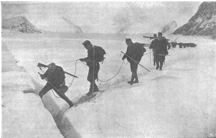
Marsch über den Aletschgletscher.