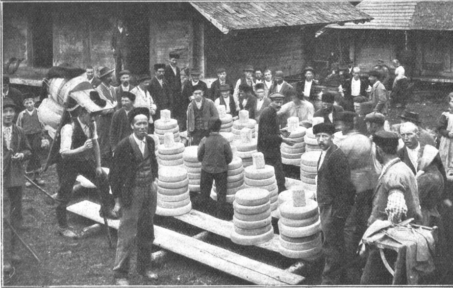
Der Kästeilet im Justistal.

Es ist Ende September. Schwer hängen die Nebel am Sigriswilergrat und spannen dichte Schleier über das schöne Justistal, das sich zwischen diesem und den kahlen Hängen der Wandfluh hinzieht. Durch das feuchte Morgengrauen bewegen sich auf den von Merligen und Sigriswil emporsteigenden Wegen zahlreiche, meist kernige Gestalten, teils von gedrungenem, teils von hochaufgeschossenem Wuchs, bald einzeln, bald in kleinen Truppen. Männer in elben, halbblennenen „Kutten“ tragen ein Räf, andere im gestrickten „Rutz“, mit runder Pelzkappe oder altmodischer Zipselmütze, eine große Hutte. Auch Frauen sind dabei: alte, zähe, einfache, die einen farbigen „Lumpen“ um den Kopf gebunden, und junge, sonntägliche aufgeputzte, mit lachenden Augen. Hier und dort trottet ein Knabe in schweren Schuhen oder ein Mädlein im roten, schöngeblumten „Schippergloshli“ nebenher.