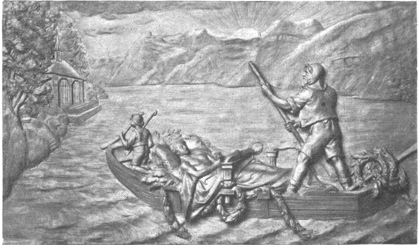
Die Bronzeplatte am Denkmal der Schweizer Begräbnisstätte zu Ohlsdorf-Hamburg.

Houriet ein Stück Felsen vom Gipfel der Jungfrau, um ihn dem Denkmal einzuverleiben.