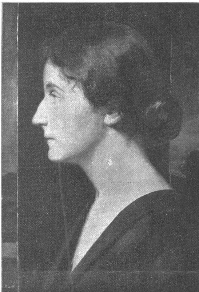
Otilie W. Roederstein, Zürich-Bosheim: Frauenkopf. Schweiz. Frauenkalender.

Der Fürsprecher machte dann freilich ein erstauntes Gesicht, als die Beiden am Morgen bei ihm ankamen und da