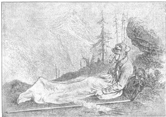
E. Whymper in seinem Schlaffack auf seinen Touren im Jahre 1861. (France). Nach dem Selbstporträt in Whymper, Berg- und Gletscherfahrten.

So versuchte er es nun mit andern Begleitern und zwar von der Ostseite, von Zermatt aus. Er schloß sich dort einer Gesellschaft an und gewann sie für eine Matterhornbesteigung.