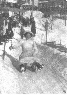
Ringstechen im Wetschlitteln

von frühmorgens an die Fenster sperrangelweit offenzuhalten. Gegenüber ist das Schlachthaus, dessen Gequatsch selbst das der Knaben in den Pausen übertönt und sie an den Anblick grausamer Martern gewöhnt. Dem Unterricht selber aber ist äusserst hinderlich das Geräusch der Fuhrwerke auf dem holperigen Pflaster des Rathhausplatzes, auf den die Fenster der meisten Schulzimmer hinaus schauen, besonders an Markttagen. Einigen dieser Uebelstände, welche jedenfalls nicht allen unter ihnen unbekannt sind, hätte abgeholfen werden können, wenn man