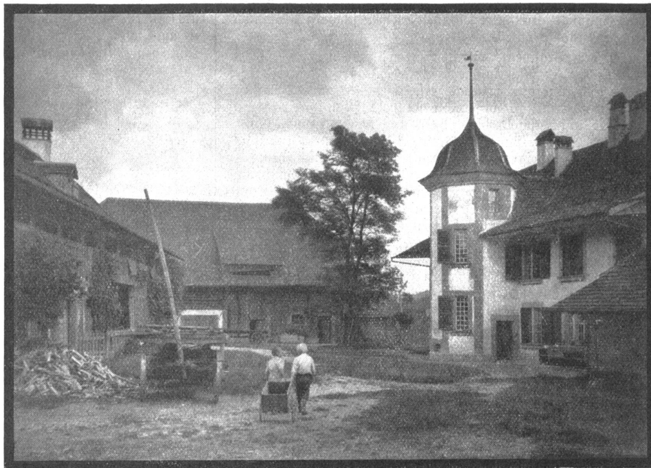
Bauernhof in Ittigen bei Bern.

Als Winkeladvokat und fleißiger Besucher der Wirtschaften hatte er schon früh alle Skandalgeschichten des Städtchens kennen gelernt. Neben der Kunst, den verwerflichsten Handlungen, vorausgesetzt, daß sie seine Klienten betrafen, vor Gericht gute Seiten abzugewinnen, hatte er es von jeher auch verstanden, den uneigennütigen Anregungen und Handlungen andrer, wo es ihm in den Kram paßte, unlaute und schlechte Beweggründe unterzuschleiben. Diese Fertigkeit bewies er auch als Mitarbeiter an dem seine Abonnenten vielfach mit Skandalgeschichten regalierenden Blatt „Tag und Nacht,“ das in der Kantonshauptstadt erschien.