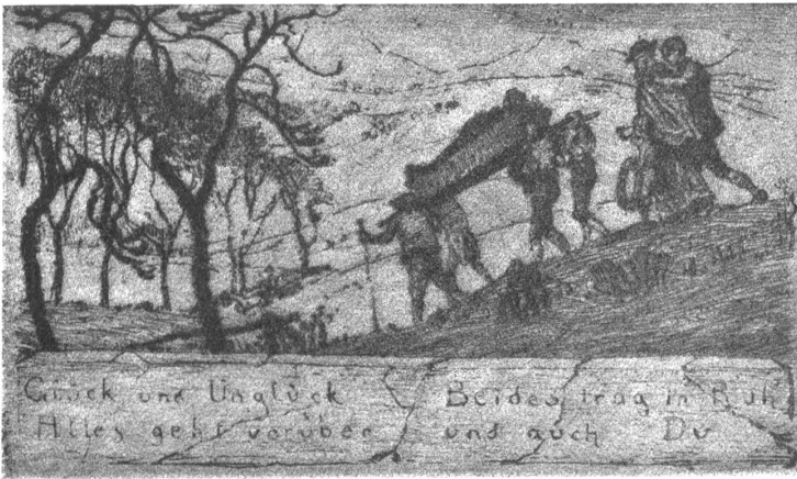
Das Begräbnis. Nach der Radierung von Albert Welti.

Dem Kunstwart bleibt das große Verdienst, durch sein wiederholtes Eintreten für Welti eine stets wachsende Gemeinde auf ihn aufmerksam gemacht zu haben, besonders durch seine Mappe, die eine Auswahl von Gemälden und graphischen Arbeiten des Künstlers in verschiedenen Reproduktionsverfahren brachte.