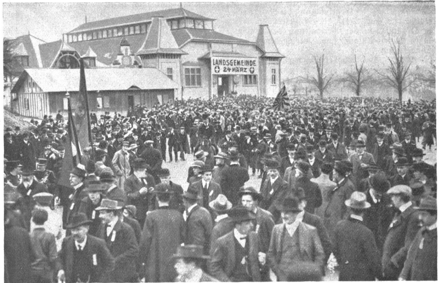
Die Landsgemeinde in Bern gegen den Gotthardvertrag. — Vor der Reitschule.

Ein feiner Sprühregen empfing in seiner ganzen Größe und Eindringlichkeit die auswärtigen Delegationen, die gegen 11 Uhr vormittags anrückten, viele Damen und zu flatternden Fahnen Musik mitbrachten. Die ersten waren die Genfer, die ein Extrazug herführte. Ihnen folgten die Waadtländer und um 12 Uhr mittags die Neuenburger und Freiburger. Die aus der Ost-, Nord-, Süd- und Zentralschweiz kamen später und waren weniger an der Zahl als die Westschweizer. Auch die studierende Jugend war stark vertreten. Der Demonstrationzug bewegte sich durch die Hauptstraßen nach dem Parlamentsplatz und von da um 2 Uhr nachmittags nach der Reitschule auf der Schützenmatte. In der Reitschule selbst haben über 10,000 Mann den Worten der zahlreichen Redner gelauscht und zum Schluß eine Resolution gefaßt, die die eidg. Räte erjucht, den neuen Gotthardvertrag nicht zu genehmigen. Zum Schluß fand nochmals ein Demonstrationzug statt, der von der Schützenmatte durch das Bollwerk, die Spitalgasse, Markt- und Amthausgasse nach dem Parlamentsplatz sich bewegte. Hier intonierte die Musik „Kufft du mein Vaterland“, die Teilnehmer sangen entblößten Hauptes mit, und es folgte ein Hoch auf das Vaterland und unter dem Gesang und der Musik des