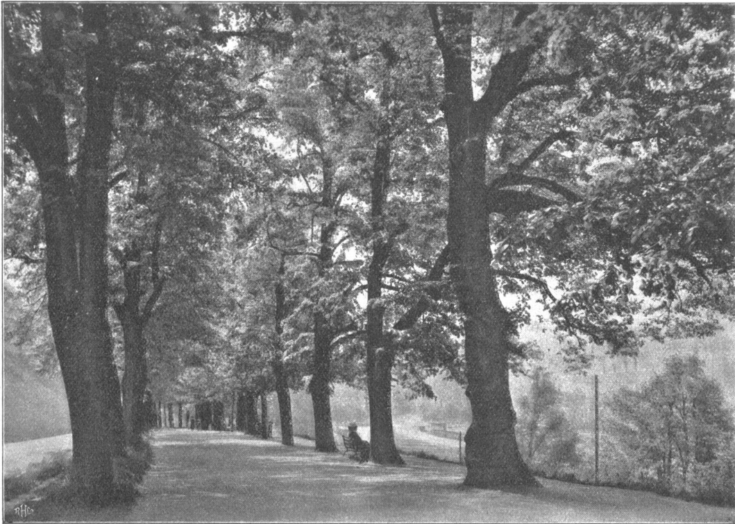
Allee am Aargauerstalden gegen die Stadt.

Herrlich wandelt sich's in diesen Laubhallen, wenn nicht gerade Pferderennen, Flugtage oder Fußballschlachten neben ihnen abgehalten werden und drangvolle Enge verursachen. Den Fremden wird man hier nicht finden, höchstens sauft er im Auto durch; umso lieber sucht der Berner in abendlicher Kühle oder im sonntäglichen Spaziergang seine Alleen auf, wo er allein daheim ist und nicht mit dem Fremdling Aus- sicht und Preise teilen muß.