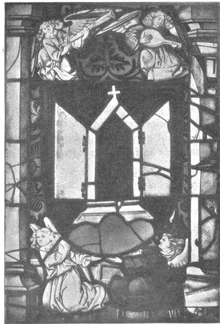
Wappenscheibe der Karthause Thorberg im Berner Münster.

Es ist einleuchtend, daß bei einem alten Burgstall, der nacheinander als Kloster, Vogteischloß, Spital und Kornhaus gedient hat, die Umwandlung in eine moderne Strafanstalt unmöglich sein kann. Bei Thorberg scheint das in der Tat der Fall zu sein, und die allzu häufigen Ausbrüche haben auch dargetan, daß trotz der scheinbar eisenfesten Mauern und hochragenden Felsen ein gewandter Freiheitslustiger den Weg aus seiner Zelle verhältnismäßig leicht findet. So haben denn