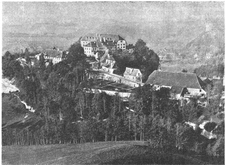
Das Zuchthaus im Jahr 1893.

Es berührt in unseren Landen den Wanderer, der Freude am Schönen und etwas Kenntnis des Vergangenen hat, oft recht eigentümlich, wenn er hochragende Schlösser als Zuchthäuser (wie eben Thorberg), berühmte Gotteshäuser wie Friesenberg als Armenanstalten, oder ehrwürdige kunstreiche Kirchen wie Payerne als Kasernen eingerichtet sieht. Mancher mag vielleicht sogar mit Recht bedauern, wenn ein Haus vom Rang des Erlacherhofs in Bern zum Verwaltungsgebäude degradiert wird. Viel würdiger wäre freilich die Verwendung als Museum oder wissenschaftliche Anstalt, wenn nicht immer wieder der Herr Finanzminister notgedrungen mit einer Rentabilität seiner Domänen vor die Volksvertretung treten müßte. Hoffen wir, daß das neue Thorberg eine Bestimmung erhält, die dem romantischen Geist etwas näher kommt, welcher Jeremias Gotthelf's „Letzten Thorberger“ schuf!