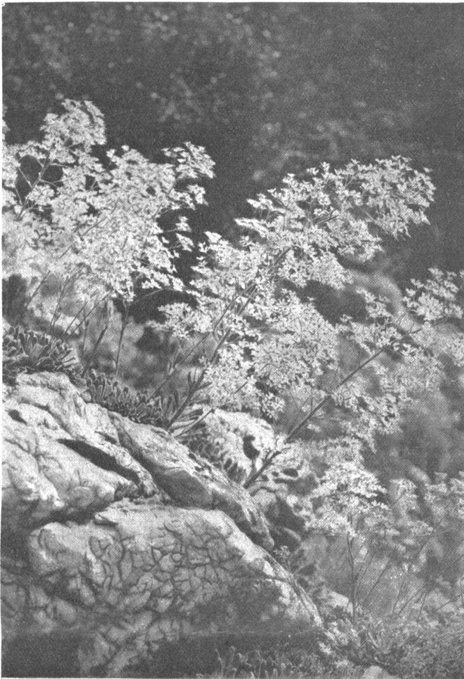
Saxifraga altissima im Alpinum des botanischen Gartens in Bern.

seiner Verpflegung einen Aufwand machen, der billig berechnet 94 Millionen betrug. Obendrein blieben die besten preussischen Festungen von Franzosen besetzt, die sich vom Land ernährten. In Berlin, wo Fichte den Studenten der neuen Hochschule seine begeisternden „Reden an die deutsche Nation“ hielt, standen 20 000 fremde Truppen, und in seinem Potsdam saß Friedrich Wilhelm III., dem unlängst die vielbetrauerte Königin Louise gestorben war, mit ein paar Gardisten halbwegs als ein Gefangener Napoleons. So wie dieser eines Tages einem schweizerischen Gesandten zornig bemerkte, es könnte sein, daß er einmal um Mitternacht aufstünde und die Einverleibung der Schweiz unterzeichnete, so war auch Friedrich Wilhelm zu keiner Stunde vor der Aufteilung seiner Gebiete gesichert.